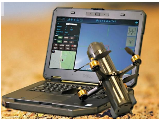
Рис.1 – Дрон-камикадзе

Применение противодронов подразумевает использование дронов-перехватчиков (рис.1) или дронов-камикадзе (рис.2). Предполагается наличие парка автоматизированных дронов и в ряде случаев специально подготовленного оператора. Возникает необходимость в дополнительных ресурсах, также техническом обслуживании и ремонте дрона после каждого налета противника на охраняемый объект. Такой метод мало пригоден для охраны объекта от средних и больших БВС (в основном самолетного типа), а также в условиях применения БАС. Система рассчитана на эксплуатацию в умеренных погодных условиях, что является безусловным ограничением в ее применении.